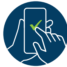
Smarte, proaktive Entstörung 4b