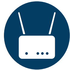
Kompatibler Router (Voraussetzung, nicht im Tarif enthalten)