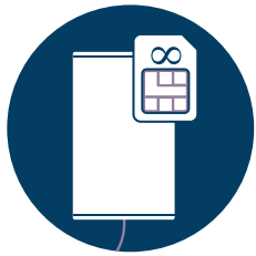
5G Backup Modul 4a inkl. SIM-Karte mit unbegrenztem Datenvolumen